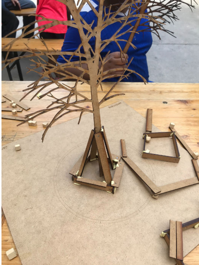
Pied d'arbre : Le Tipi