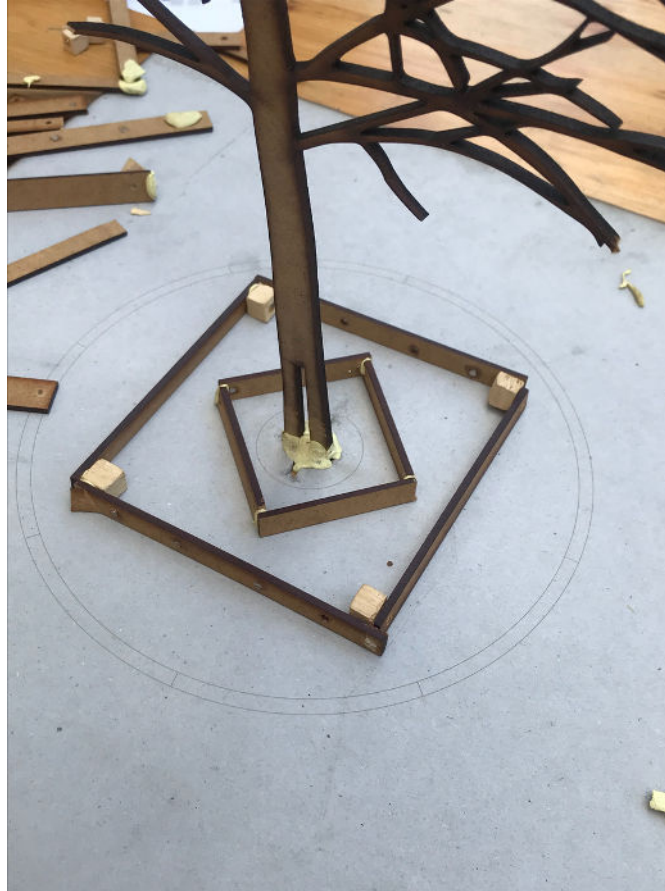
Pied d'arbre : le Losange